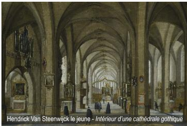
Hendrick Van Steenwijk le jeune - Intérieur d'une cathédrale gothique

Une collection n'existe pas sans passion... Le Musée de Flandre à Cassel présente Sacrée Architecture ! du 15 février au 14 juin 2020, une collection à laquelle un homme a consacré plus de quarante années de sa vie.