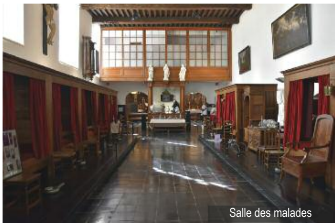
Salle des malades

Au départ, l'Hôpital est une institution caritative. La médicalisation ne s'installe que progressivement. La manière d'envisager