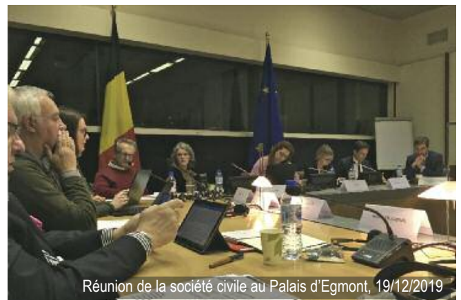
Réunion de la société civile au Palais d'Egmont, 19/12/2019

Convaincue du rôle essentiel joué par la société civile, l'APFF sera dorénavant particulièrement vigilante quant à la mise en place d'une réelle collaboration entre les autorités et