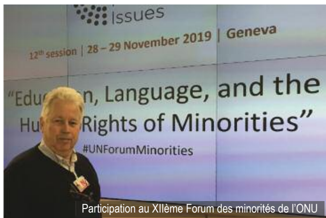
Participation au XIIème Forum des minorités de l'ONU

L'Association pour la Promotion de la Francophonie en Flandre (APFF) qui était également mandatée pour représenter l'Association de Promotion des Droits Humains et des Minorités (ADHUM) a saisi l'occasion qui lui était donnée de participer au XIIème Forum des minorités de l'ONU pour dénoncer les discriminations au niveau de l'éducation subies par la minorité francophone en Flandre.