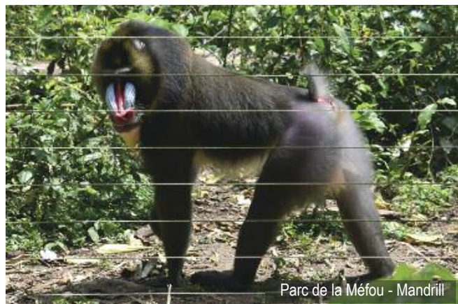
Parc de la Méfou - Mandrill