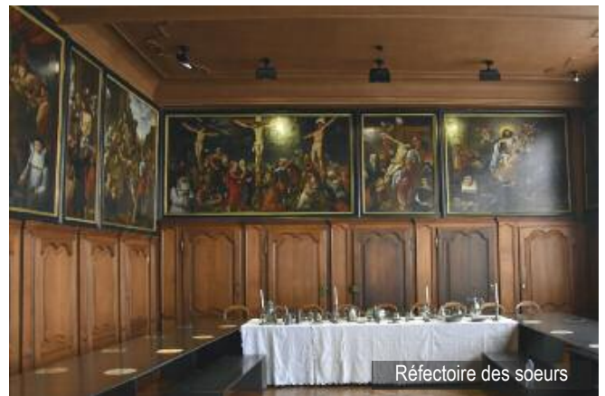
Réfectoire des sœurs

Informations : https://www.notredamealarose.be