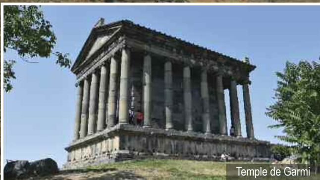
Temple de Garni