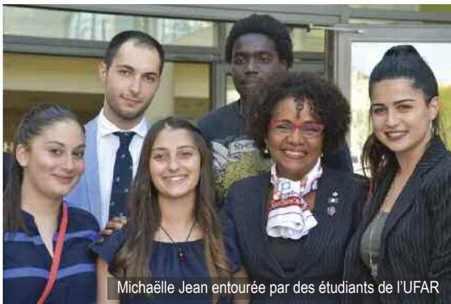
Michaëlle Jean entourée par des étudiants de l'UFAR

ploi arménien » explique le recteur. En marge du Sommet de l'OIF, l'UFAR a organisé un Colloque international intitulé « Les élites féminines dans l'espace francophone » réunissant des personnalités de plus de 10 pays et rehaussé par la participation de Michaëlle Jean, Secrétaire générale de la Francophonie.