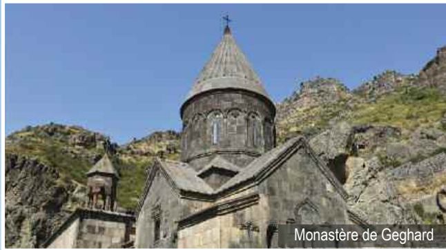
Monastère de Geghard