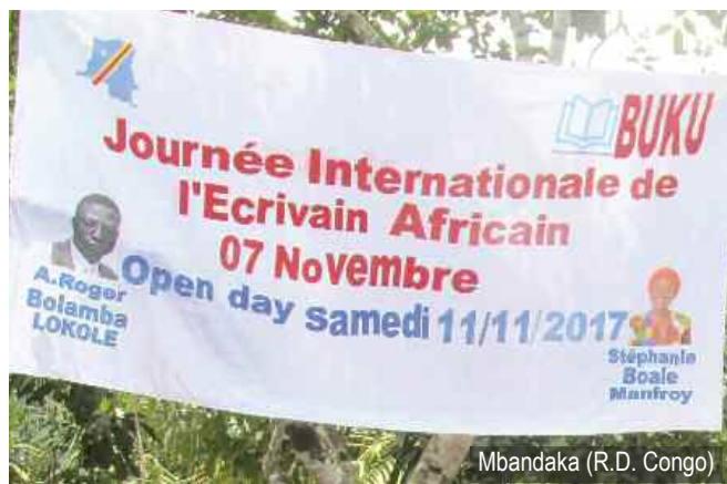
Mbandaka (R.D. Congo)

* Le 09/11/2018 à 18h30 à l'Horloge du Sud, rue du Trône 141, 1050 Ixelles. Infos : http://www.buku-litterature.com