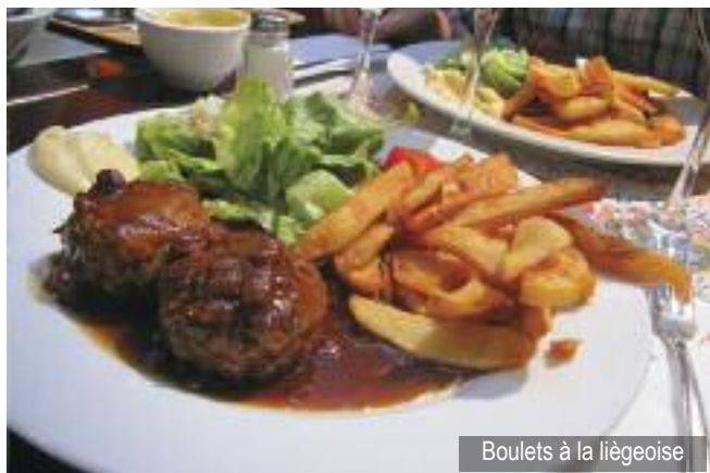
Boulets à la liégeoise

La métropole bat aussi au rythme de son fameux marché de la Batte qui prend place, chaque dimanche matin, sur les quais de la Meuse. C'est le plus grand et le plus ancien marché de Belgique voire de l'Europe du nord. Il attire des chalandes de toute la région, d'Aix à Maastricht, autant pour y flâner et pour le plaisir des rencontres que pour y faire leurs