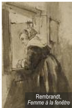
Rembrandt, Femme à la fenêtre