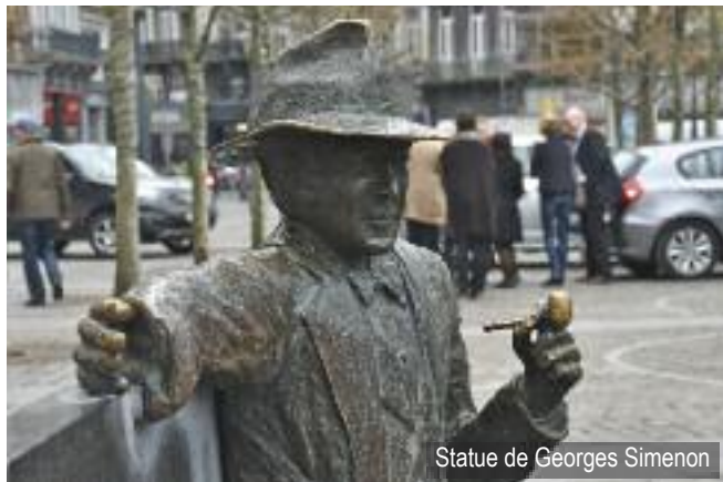
Statue de Georges Simenon

Informations : Office du tourisme de Liège, + 32 (0)42.21.92.21.