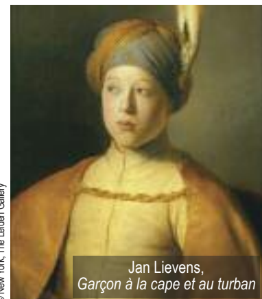
Jan Lievens, Garçon à la cape et au turban