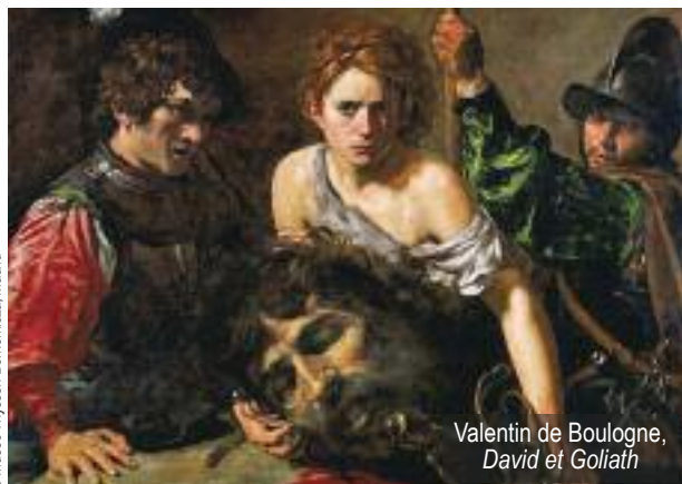
Valentin de Boulogne, David et Goliath

Informations : Musée du Louvre – www.louvre.fr