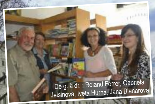
Bibliothèque jeunesse de Kosice

Dans le cadre de la Journée internationale de la Francophonie, l'APFF soutient, cette année encore, des projets de promotion du français. Nous avons déjà mené des actions similaires les années précédentes. Rappelez-vous la participation à l'achat d'un vidéo-projecteur pour des tables de conversation à Pondichéry, l'achat de prix pour un concours de dictée au Sénégal ou l'envoi de livres pour une école en Haïti. Cette année, nous aidons un projet en Slovaquie et un autre à Hanoï.