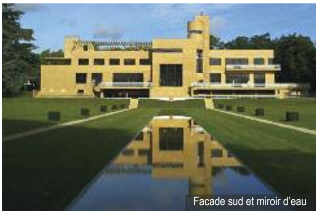
Facade sud et miroir d'eau

Informations : www.villa-cavrois.monuments-nationaux.fr