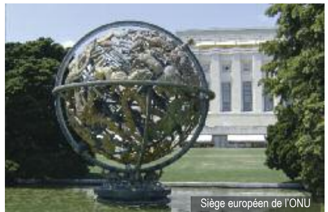
Siège européen de l'ONU