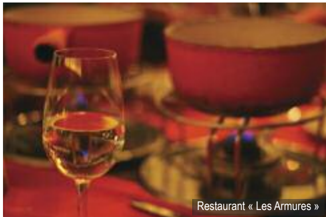
Restaurant « Les Armures »