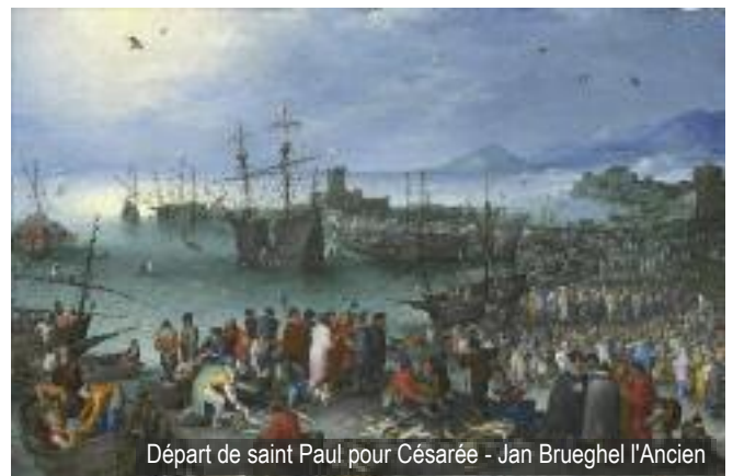
Départ de saint Paul pour Césarée - Jan Bruegel l'Ancien