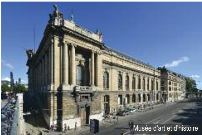
Musée d'art et d'histoire

Genève compte plusieurs musées de premier plan. Le Musée d'ethnographie (MEG) avec une collection de 80 000 pièces issues de 1 500 cultures différentes. Pour les amateurs d'art, le Musée d'art et d'histoire présentant des œuvres de Ferdinand Holder, Giacometti, Picasso ou le MAMCO, le plus