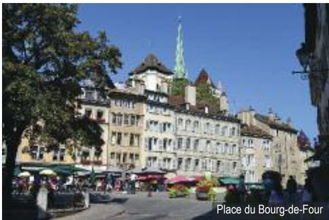
Place du Bourg-de-Four

Facilement visitable à pied, ce quartier recèle de nombreux trésors historiques comme l'hôtel de ville, la place du Bourg-de-Four ou la promenade de la Treille. On est plongé dans l'époque de la Réforme avec le mur des Réformateurs, le cimetière des Rois ou le musée international de la Réforme situé juste à côté de la Cathédrale St-Pierre. Après avoir visité la maison Tavel (la plus vieille de Genève), on remonte la Grand'Rue où ont vécu d'illustres riverains comme Jean-Jacques, Michel Simon ou Jorge Luis Borges.