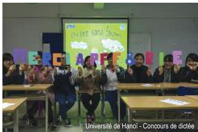
Université de Hanoï - Concours de dictée