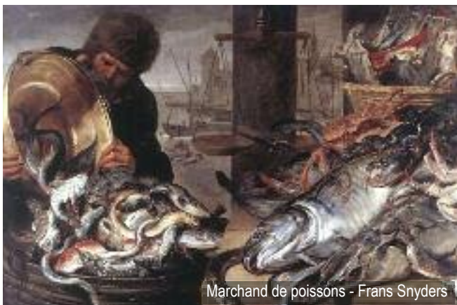
Marchand de poissons - Frans Snyders

Informations : http://museedeflandre.lenord.fr