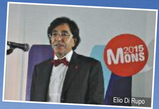
Elio Di Rupo