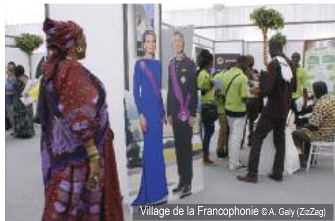
Village de la Francophonie

L'élargissement, ensuite : après le Qatar et l'Ukraine au précédent Sommet, on a admis le Mexique (qui a certes une vieille histoire conflictuelle avec la France), le Kosovo (qui a certes été administré par le Français Bernard Kouchner), et le Costa Rica (qui a certes une vieille élite francophone). ☞