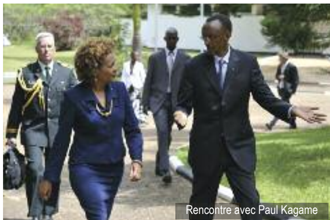
Rencontre avec Paul Kagame