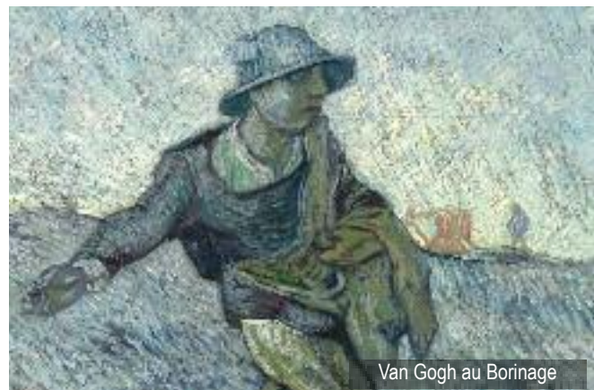
Van Gogh au Borinage