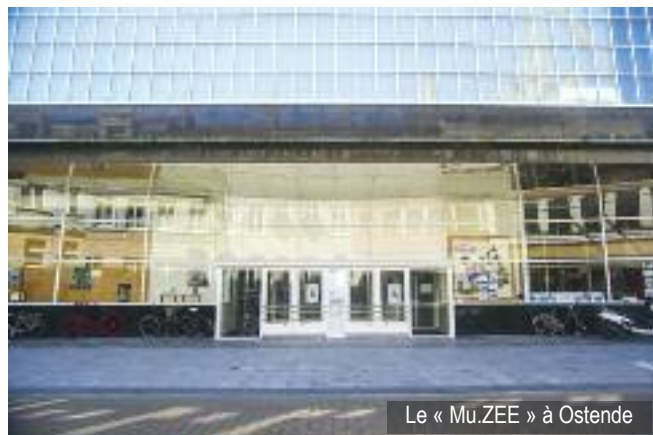
Le « Mu.ZEE » à Ostende