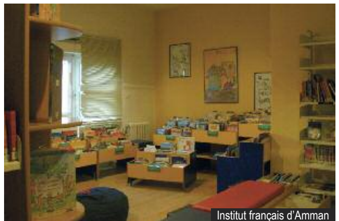
Institut français d'Amman