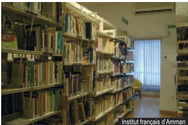
Institut français d'Amman