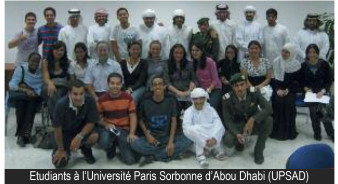
Etudiants à l'Université Paris Sorbonne d'Abou Dhabi (UPSAD)

(UPSAD) à laquelle l'université Paris IV apporte, en plus de son label « Sorbonne », son ingénierie et ses enseignants. Cette université, à la fois laïque et mixte, comptait 509 étudiants à la rentrée 2010 et pourra, à terme, accueillir 2 500 étudiants.