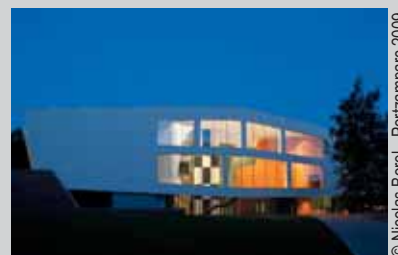
© Nicolas Borel - Portzamparc 2009

L'« Association francophone du Grand Zaventem », l'« Association des Français de Gand » et l'« Association culturelle de Grimbergen » font une escapade à Louvain-la-Neuve, pour visiter ce nouveau musée, ouvert en juin dernier, qui offre un parcours au cœur de la création d'un des grands artistes du 20ème siècle. Plus de 80 planches originales, 800 photos, documents et objets rassemblés en un seul lieu. Un musée que son créateur, Christian de Portzamparc, a rêvé puis réalisé au sein d'un écrin de verdure en plein Brabant wallon.